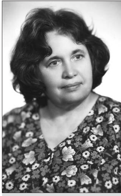
Publikācijas autore Aurora Polosuhina.

A. Polosuhina, Latvijas Antihitleriskās koalīcijas cīnītāju asociācijas biedre